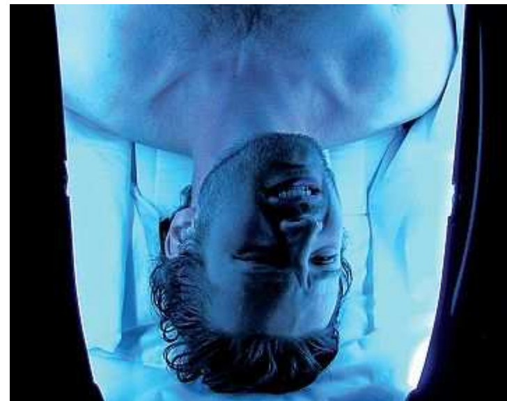
Una scena di 'Nei molti mondi'. In alto, un ritratto di Philip K. Dick